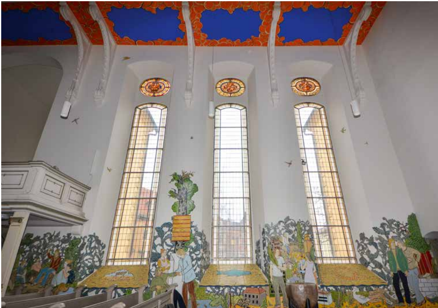
Bergpredigt in Moritz Götzes Interpretation | Foto: Sven Baier, © VG Bild-Kunst