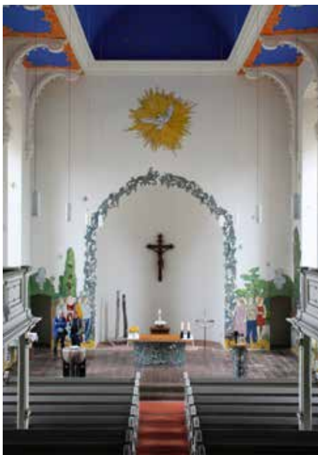
Blick von der Empore in die Apsis von St. Ägidien, Bernburg

Moritz Götze ist bekannt dafür, dass seine Arbeiten voller Zitate sind; viele sind ganz offen Neuformulierungen altmeisterlicher Positionen. 2 So hat er auch von mittelalterlichen Altären das Prinzip übernommen, alle Figuren mit den modischen und habituellen Stilen der Jetztzeit auszustat-