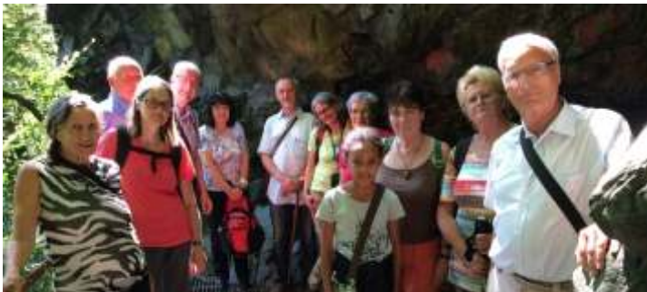
Gemeindewanderung am 24. Juni nach Heinrichsruh

Wir treffen uns um 13.00 Uhr vor der Marienkirche und erklimmen den Hainberg. Dann gehen wir am Schlosspark und Schloss Osterstein vorbei auf schönen Wegen, die nur Frau Sterna kennt, durch den Stadtwald. Wenn wir Lust haben, machen wir einen Abstecher ins Haus Schulenburg. Irgendwo treffen wir auf eine Blockhütte, wo wir die mitgebrachten Glühweinvorräte verzehren.